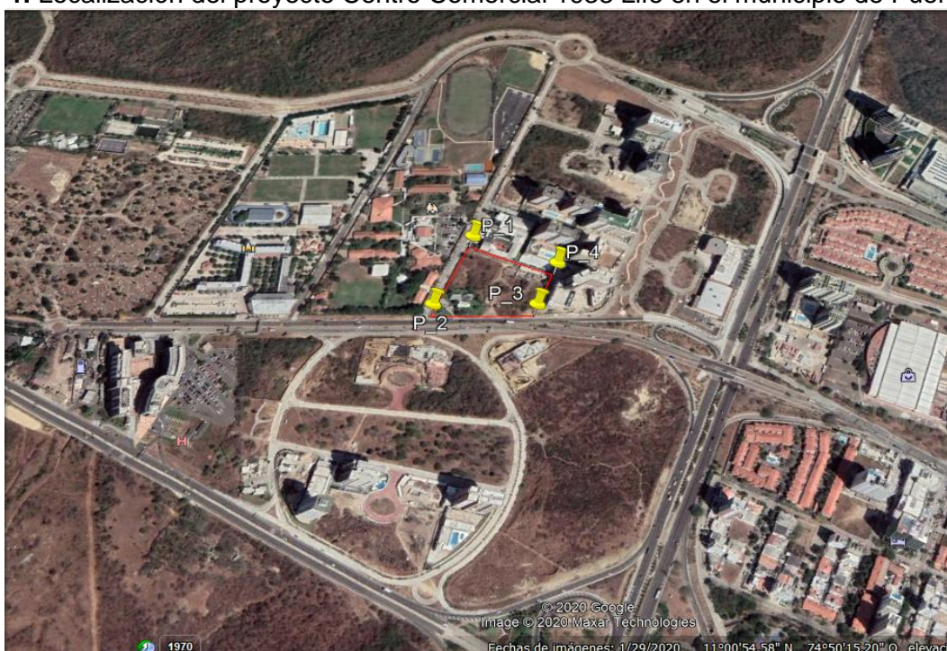
Ilustración 1. Localización del proyecto Centro Comercial 1933 Life en el municipio de Puerto Colombia

Handwritten signature or mark in red ink.